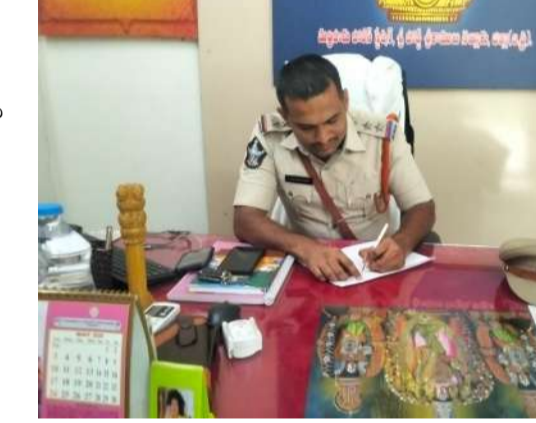
అర్హులైన ఓటరు, నిర్ణీత గడువులోగా సంబంధిత బూత్ లెవల్ ఆఫీసర్ (డీసా) మీ ఇంటిని సందర్శించిన సందర్భంగా మీకు అందజేసిన జాబ్ ఫారమ్లను పూర్తిగా నింపి,