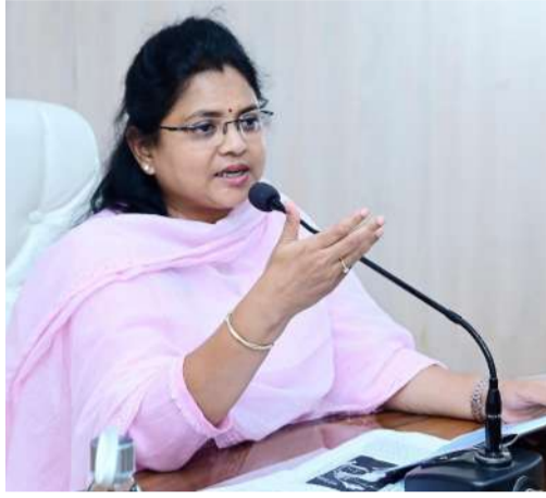
కళాశాలలో కేంద్ర ప్రభుత్వం 12 సంవత్సరాల అభివృద్ధి విజయాలను ప్రజలకు వివరించే సమగ్ర కమ్యూనికేషన్ చేశారు.