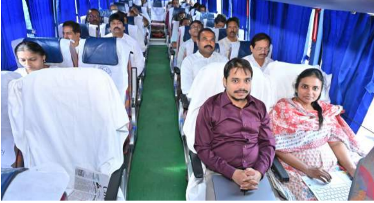
కావాలని కోరారు. "సాధ్యమైనంత వరకు వ్యక్తిగత వాహనాల వాడకాన్ని తగ్గించి, ఆర్టీసీ బస్సుల వంటి ప్రజా రవాణా వ్యవస్థలను అలవాటు చేసుకోవాలి. మన సొంత రవాణా సంస్థ అయిన ఆర్టీసీని ఆదరించడం ద్వారా పర్యావరణానికి మేలు జరగడమే కాకుండా, ప్రభుత్వ సంస్థలు బలోపేతం అవుతాయి." డా. ఏ. సిరి, జిల్లా కలెక్టర్

ఆర్టీసీ బస్సులో ప్రయాణం.. ప్రజా సమస్యల పరిశీలన: 'ఒక్క నెల-ఒక నియోజకవర్గం-నాలుగు పర్యటనలు' కార్యక్రమంలో భాగంగా పత్రికాండ నియోజకవర్గంలోని తుగ్గలి మండలంలో ప్రజా సమస్యల వినతులను స్వీకరించేందుకు కలెక్టర్, జేసీ బయలుదేరారు. ఈ పర్యటన కోసం వారు ఆర్టీసీ బస్సును ఎంచుకున్నారు. సామాన్య ప్రయాణికులతో కలిసి ప్రయాణిస్తూ ఆర్టీసీ బస్సుల ప్రాధాన్యతను చాటిచెప్పారు.