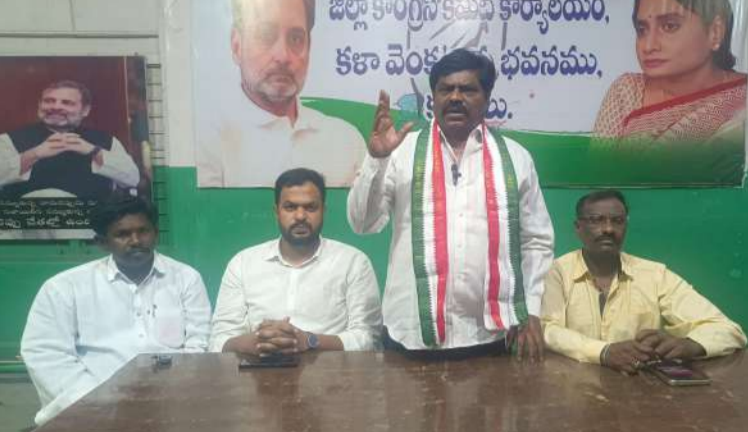
విద్యార్థులకు కార్పొరేట్ స్థాయి విద్యను అందించేందుకు చర్యలు తీసుకోవాలని మరియు ఎస్సీ కార్పొరేషన్ ద్వారా బ్యాంకు లింకుడు ఎన్ ఎస్ ఎఫ్ డి సి క్రింద లోన్లు మంజూరు చేసి ఎస్సీ కుటుంబాలను అభివృద్ధి పథంలో ముందుకు తీసుకువెళ్లాలని కాంగ్రెస్ పార్టీ తరపున డిమాండ్ చేస్తున్నామని అని మాట్లాడారు.

ప్రతివక్ష చోదాలో అసెంబ్లీలో నిండు సభలో జగన్మోహన్ రెడ్డి ఎస్సీ ఎస్టీలకు తొలగించిన పథకాలన్నీ మా ప్రభుత్వం వస్తే వెంటనే పునరుద్ధరిస్తామని అసెంబ్లీ సాక్షిగా చెప్పాడు మరి ఈనాడు కూటమి ప్రభుత్వం వచ్చి రెండు సంవత్సరాలు అయిపోయిన ఎస్సీలకు సంబంధించిన ఎటువంటి విస్తరించజేస్తామని హామీ ఇచ్చింది. ప్రభుత్వం వచ్చి రెండు సంవత్సరాలయిపోయింది ముఖ్యమంత్రి చంద్ర బాబునాయుడు మంత్రి లోకేశ్ బాబు ఈ విద్యా సంవత్సరంలోనే బెస్ట్ అవైలబుల్ సూల్స్ (బి ఏ యస్ ) పథకాన్ని తిరిగి ప్రారంభించి, పేద మరియు బలహీన వర్గాల