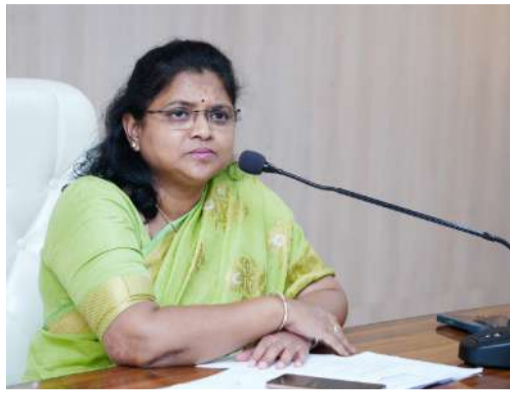
వ్యవసాయానికి కీలకమైన సాగునీటి వ్యవస్థలను సకాలంలో నిర్మించేందుకు అత్యంత ప్రాధాన్యతగా తీసుకోవాలని అధికారులకు సూచించారు. కాలువలు, డ్రైన్లను పూడికతీత, కాలువల శుభ్రపరిచే పనులు, గేట్ల మరమ్మత్తులు, లీకేజీల నివారణ వంటి పనులను నాణ్యతతో పాటు వేగంగా పూర్తి

భీమవరం: బ్యూరో చీఫ్ జూన్ 29 నంది పత్రిక జిల్లాలో రైతాంగానికి సాగునీటి సరఫరాలో ఎలాంటి అంతరాయం కలగకుండా ఇరిగేషన్, డ్రైన్స్ నిర్వహణ పనులను యుద్ధప్రాతిపదికన పూర్తి చేయాలని జిల్లా కలెక్టర్ చదలవాడ నాగరాణి సంబంధిత అధికారులను ఆదేశించారు. కలెక్టరేట్లోని వశిష్ట సమావేశ మందిరంలో సోమవారం ఇరిగేషన్ అవరేషన్ అండ్ మెయింటెనెన్స్ ( ఓ & ఎం) పనుల పురోగతిపై సబ్ డివిజన్ వారిగా అధికారులతో నిర్వహించిన సమీక్ష సమావేశంలో జిల్లా కలెక్టర్ చదలవాడ నాగరాణి మాట్లాడారు. జిల్లాలో మొత్తం 374 ఇరిగేషన్ పనులు మంజూరు కాగా, ఇప్పటివరకు 338 పనులు గ్రౌండ్రింగ్ పూర్తి వివిధ దశల్లో పురోగతిలో ఉన్నాయని తెలిపారు. అదేవిధంగా 32 షట్లర్ మరమ్మత్తు పనులు కూడా వివిధ దశల్లో కొనసాగుతున్నాయని పేర్కొన్నారు.