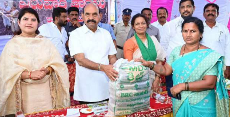
రైతులు మెరుగైన దిగుబడిపై దృష్టి సారించాలి భూసార పరీక్షలకు అనుగుణంగా ఎరువులను వాడాలి