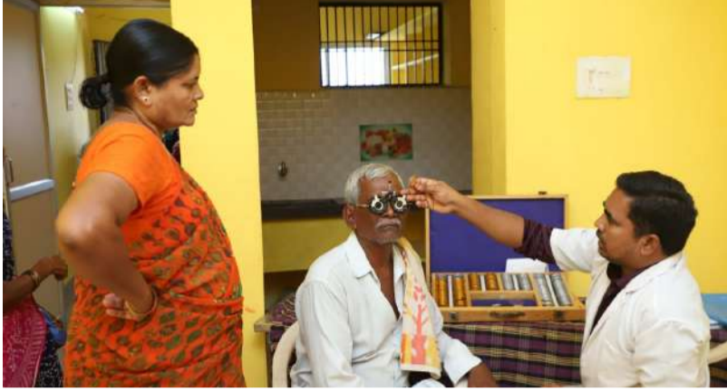
విజయవంతంగా 68వ పెద్దరెడ్డి తిమ్మారెడ్డి మోగా వైద్య శిబిరం..