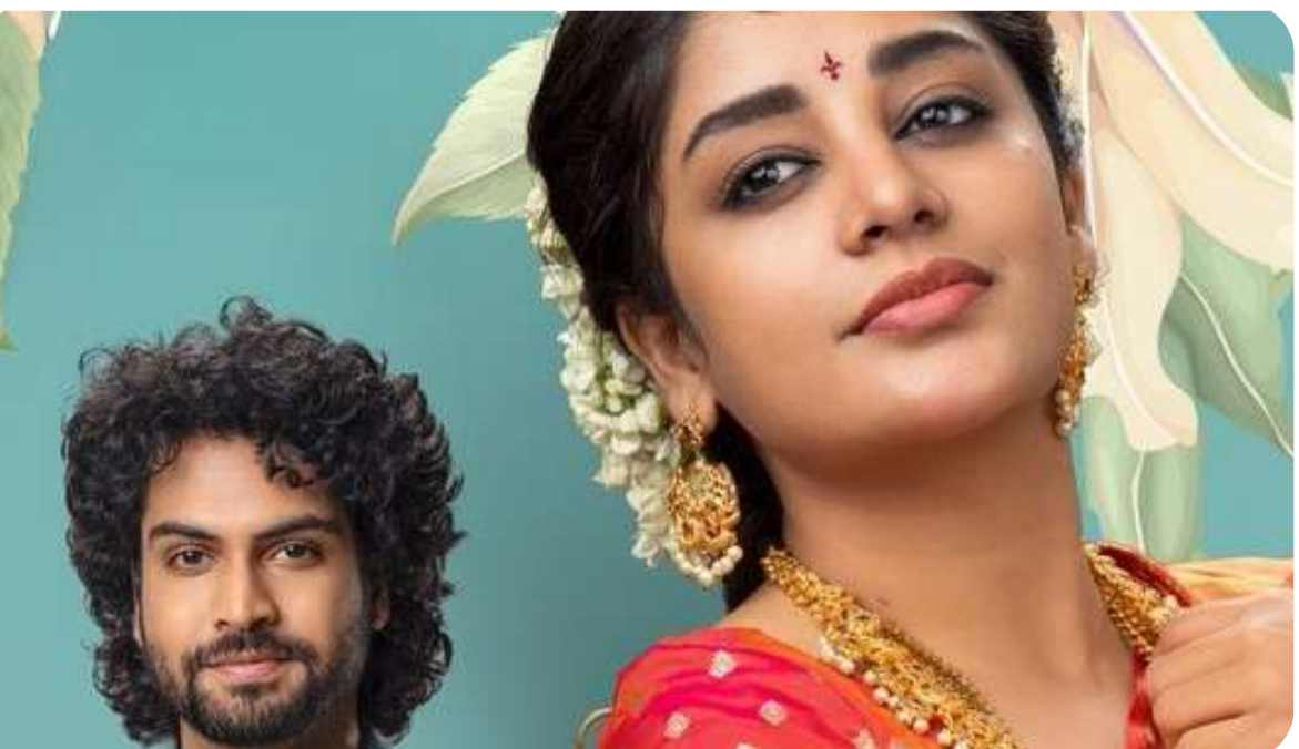
సన్నిహితు లంతా వాళ్ల నిర్ణయం పట్ల హర్షాన్ని వ్యక్తం చేస్తారు. అలాంటి ఆ సమయంలో ఏం జరిగిందనే ఒక

డీలాపడిపోతాడు. పోయింది నడక మాత్రమే తప్ప, భవిష్యత్తు కాదనే సంజన మాటలు అతనిలో కొత్త ఆశలను రేకెత్తిస్తాయి. వాళ్లిద్దరి మధ్య పరిచయం ప్రేమగా మారుతుంది. సంజనకి చూపులేని కారణంగా సంబంధాలు రావడమే కష్టమై పోతుంది. వచ్చిన సంబంధాలు ఆమె పెంచుతున్న పిల్లల కారణంగా వెళ్లిపోతుంటాయి. అలాంటి సమయంలో ఆమె రాజ్ ను ప్రేమించడం బామ్మకు ఆనందాన్ని కలిగిస్తుంది. ఇక ఒంటరిగా మిగిలిపోయిన దగ్గర నుంచి కుమిలిపోతున్న రాజ్, సంజన రాకతో సంతోషంగా ఉండటం కిశోర్ దంపతులకు ఆనందాన్ని ఇస్తుంది. సంజన - రాజ్ పెళ్లి చేసుకుందామని అనుకుంటూ ఉండగా ఒక అనూహ్యమైన సంఘటన జరుగుతుంది. అదేమిటి? అది వాళ్ల జీవితాలను ఎలా ప్రభావితం చేస్తుంది? అనేది కథ చూపులేని అమ్మాయి.. కాళ్లు లేని అబ్బాయి. ఒకరు కవి అయితే.. మరొకరు గాయని. అలాంటి ఈ ఇద్దరి మధ్య నడిచే ప్రేమకథ ఇది. ఇద్దరూ ఆయా సందర్భాలలో తల్లిదండ్రులను కోల్పోయినవారే. అలాంటి ఆ ఇద్దరూ కలిసి నడవాలని అనుకుంటారు కలిసి బతకాలని నిర్ణయించుకుంటారు.