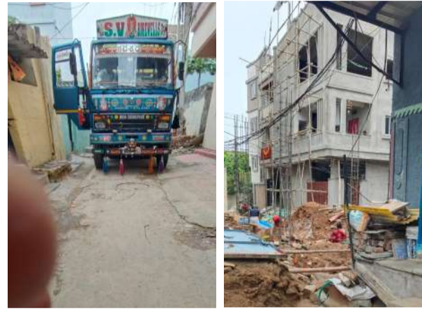
అధికారులు ఫిర్యాదులు చేసినప్పటికీ, అలాగే పత్రికల్లో వార్తలు ప్రచురితమైనప్పటికీ ఇప్పటివరకు ఎలాంటి కఠిన చర్యలు తీసుకోలేదని వారు ఆరోపిస్తున్నారు.

జగ్గిలిగుట్ట లింగ్ బస్తీ ప్రాంతంలో నిబంధనలకు విరుద్ధంగా పెద్ద ఎత్తున నిర్మాణాలు కొనసాగుతున్నాయని స్థానిక తీవ్ర ఆందోళన చేస్తున్నారు. పలువార్లు సంబంధిత