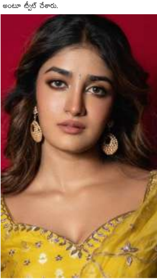
అంటూ ట్వీట్ చేశారు.