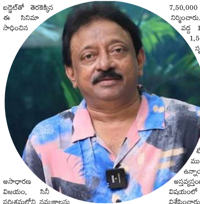
అసాధారణ విజయం, సినీ పరిశ్రమలోని నమ్మకాలను పరీక్షిస్తుందని, ఇది ఒక 'రీసెట్ బటన్' లాంటిదని ఆయన అభిప్రాయపడ్డారు. ఈ మేరకు తన సోషల్ మీడియా ప్లాట్‌ఫామ్ ఎక్స్ లో ఆయన సుదీర్ఘ విశ్లేషణను పంచుకున్నారు. కర్ర బార్బర్ దర్శకత్వంలో వచ్చిన 'అబ్బెషన్' చిత్రాన్ని కేవలం

భారీ బడ్జెట్, స్టార్లు లేకుండానే విజయాలు సాధ్యమని వర్మ వ్యాఖ్య ఫిల్మ్ ఎడిటింగ్, సౌండ్ డిజైన్ టెక్నిక్స్పై వర్మ ఆసక్తికర విశ్లేషణ ప్రస్తుతం సినీ వర్గాల్లో వర్మ వ్యాఖ్యలు చర్చనీయాంశం