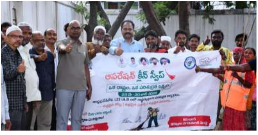
నగరపాలక కమిషనర్ చల్లా ఓబలేసు పిలుపు బల్డిన్ పండుగకు ఈడాల వద్ద ప్రత్యేక పర్యాటకులు

కర్నూలు నంది పత్రిక బ్యారో.... 'అవరేషన్ క్లీన్ స్టీట్' కార్యక్రమంలో భాగంగా నగర వ్యాప్తంగా చేపడుతున్న స్వచ్ఛత కార్యక్రమంలో ప్రజలంతా భాగస్వాములు కావాలని నగరపాలక సంస్థ కమిషనర్ చల్లా ఓబలేసు పిలుపునిచ్చారు. మంగళవారం స్థానిక జమ్మిచెట్టు వద్ద ఉన్న ఈడాల వద్ద అవరేషన్ క్లీన్ స్టీట్ కార్యక్రమాన్ని నిర్వహించారు. మున్సిం సోదరులతో కలిసి కమిషనర్ స్వచ్ఛత పనులు చేపట్టారు. అనంతరం స్వచ్ఛత ఆవశ్యకతపై అవగాహన