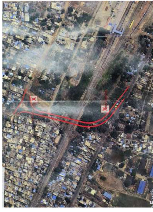
పరమాపధిగా అధికారులు సమన్వయంతో పనిచేయాలని " మంత్రి ఎన్ఎండి ఫరూక్ అధికారులను ఆదేశించారు. ఈ సమావేశంలో సంబంధిత శాఖల అధికారులు, ప్రజాప్రతి నిధులు మరియు ముఖ్య నాయకులు పాల్గొన్నారు.

గాంధీనగర్ రైల్వే గేట్ అదేవిధంగా, నిరంతరం ట్రాఫిక్ తో బిజీగా ఉండే గాంధీనగర్ సమీపంలోని రైల్వే గేట్ వద్ద కూడా ప్రజల ఇబ్బందులను దృష్టిలో ఉంచుకుని, అక్కడ అండర్ పాస్ వేయాలా లేక బ్రిడ్జి నిర్మించాలా అనే సాంకేతిక మరియు క్షేత్రస్థాయి అంశాలపై అధికారులతో సమీక్షించారు. "నంద్యాల పట్టణ ప్రజలకు ట్రాఫిక్ కష్టాలు కలగకుండా, భవిష్యత్తు అవసరాలను కూడా దృష్టిలో ఉంచుకుని ఈ ప్రాజెక్టులపై త్వరితగతిన నివేదికలు సిద్ధం చేయాలని. ప్రజా ప్రయోజనాలే