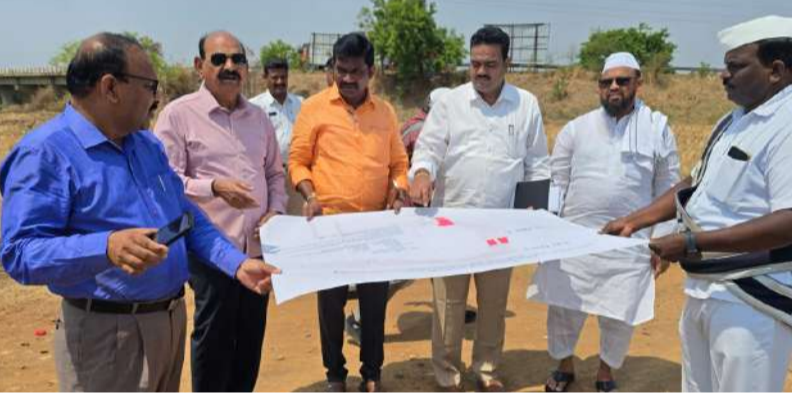
పేదలకు 'రెండు సెంట్ల' స్థలం ఇస్తాం స్వయంగా స్థలాలను పరిశీలించిన మంత్రి ఫరూక్

నంద్యాల సీటీ బ్యారో మే 21 (నంది పత్రిక) నంద్యాల బొగ్గులైన్ బాధితులకు అండగా ఉంటామని, వారికి పునరావాసం కల్పించేందుకు యుద్ధప్రాతిపదికన చర్యలు తీసుకుంటున్నామని ఆంధ్రప్రదేశ్ రాష్ట్ర న్యాయ మరియు మైన్ల సంక్షేమ శాఖ మంత్రి ఎన్ఎండి ఫరూక్ స్పష్టం చేశారు. గురువారం నంద్యాలలో బొగ్గులైన్ బాధితుల కొరకు స్థల సేకరణ ప్రక్రియలో భాగంగా మంత్రి ఫరూక్ స్వయంగా