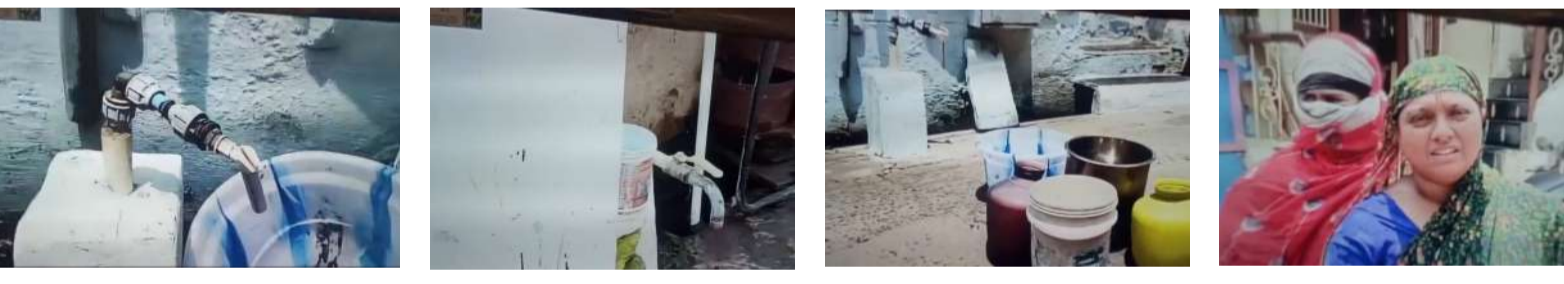
వేసవి, వర్ష, చలి కాలంలో మాకు ఈ కష్టాలు తప్పడం లేదు. నీళ్లు ఇవ్వారు కానీ కానీ మాత్రమే.

నంద్యాల సీటీ బ్యారో మే 21 (నంది పత్రిక) నంద్యాల పట్టణం ఫరూక్ నగర్ లో ప్రజలు నీటి కష్టాలకు గురవుతున్నారు. మంత్రి ఫరూక్ పేరు ఉన్న ఫరూక్ నగర్ లో మంచినీటి కష్టాలు ఉండడం విశేషం. వివరాల్లోకి వెళితే ఫరూక్ నగర్ లో అందరూ పనులకు వెళ్లి జీవనం సాగిస్తారు. ఉదయం వెళ్ళిన వారు సాయంత్రం ఇంటికి చేరుకుంటారు. పనులు చేసి అలసిపోయిన వారికి గుత్తెరు మంచి నీళ్లు తాగడం అంటే ఎప్పుడూ ఇస్తారో ఎవరికి తెలియడం లేదు. మంచి నీళ్ల సమస్య