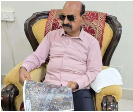
బొమ్మల సత్రం, గాంధీనగర్ రైల్వే గేట్ల వద్ద అండర్ పాస్ లేదా బ్రిడ్జిల నిర్మాణాలపై చర్చ ఆర్ అండ్ బి గెస్ట్ హౌస్ లో ఉన్నతాధికారులతో మంత్రి కీలక సమావేశం

నంద్యాల సీటీ బ్యారో మే 21 (నంది పత్రిక) నంద్యాల పట్టణ ప్రజలు ఎదుర్కొంటున్న ప్రధాన ట్రాఫిక్ సమస్యల పరిష్కారమే ధ్యేయంగా ఆంధ్రప్రదేశ్ రాష్ట్ర న్యాయ మరియు మైన్ల సంక్షేమ శాఖ మంత్రివర్గం ఎన్ఎండి ఫరూక్ గారు ఈరోజు స్థానిక ఆర్ అండ్ బి గెస్ట్ హౌస్ నందు ఒక కీలక సమావేశం సమావేశాన్ని నిర్వహించారు. పట్టణంలోని రెండు ప్రధాన రైల్వే గేట్ల వద్ద ట్రాఫిక్ ఇబ్బందులను తొలగించేందుకు చేపట్టిన ప్రత్యామ్నాయ నిర్మాణాలపై ఈ సమావేశంలో సుదీర్ఘంగా చర్చించారు.