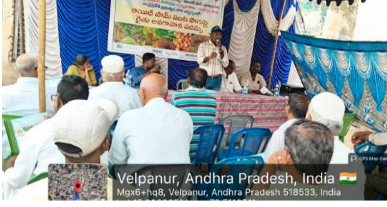
Velpalur, Andhra Pradesh, India

ప్రభుత్వం సబ్సిడీలతో రైతులకు లాభదాయకమైన పంట అధికారులు