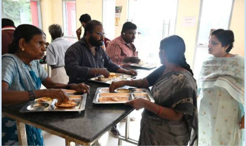
హనుమాన్ జయంతి విశిష్టత