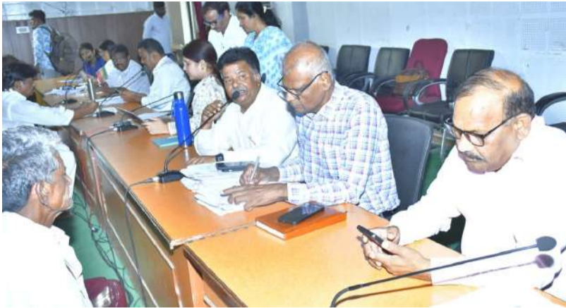
బయోండ్ ఎన్ఎల్ఎఫ్ కు వెళ్లకుండా చర్యలు తీసుకోవాలి రీఓపెన్ అర్జీలపై ప్రత్యేక దృష్టి అవసరం పీజీఆర్ఎస్ కు 272 దరఖాస్తులు స్వీకరణ

నంద్యాల జ్యూరీ, ఏప్రిల్ 27(నంది పత్రిక):- ప్రజా సమస్యలను నిర్దిష్ట గడువు (ఎన్ఎల్ఎఫ్) లోపే వేగంగా పరిష్కరించి, బయోండ్ కలెక్టరేట్లోని పీజీఆర్ఎస్ హాల్లో నిర్వహించిన ప్రజా సమస్యల పరిష్కార వేదికలో ప్రజల నుండి వినతులను స్వీకరించారు. ఈ కార్యక్రమంలో డిఆర్ఓ రామ