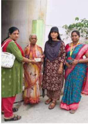
శ్రామిక శక్తి కి తిరుగులేదని ఇప్పటికీ నిరూపితమైందన్నారు. ఒకప్పుడు శ్రామికుల్ని 18 గంటల పాటు పని చేయించుకుని వారి శక్తి దోచుకుంటున్న నేపథ్యంలో ఎనిమిది గంటలకు పరిమితం చేయడంలో ఎంతోమంది శ్రామికుల పోరాటం ఫలితం ఉందన్నది అక్షరసత్యం అన్నారు. శ్రామికులు తమ హక్కుల కోసం ఎలా అయితే పోరాటం చేస్తున్నారో అలాగే