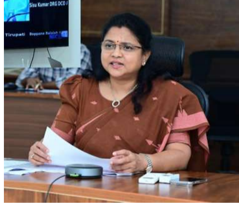
వెల్లిడిస్తూ, మే 1 నుండి 30 వరకు గృహ గణన సర్వే నిర్వహించబడుతుందని తెలిపారు. జిల్లాలో ఇప్పటివరకు సుమారు 22 వేల మంది స్వయంగా తమ వివరాలను సమోదా చేసుకున్నారని వెల్లడించారు. గృహ గణనలో