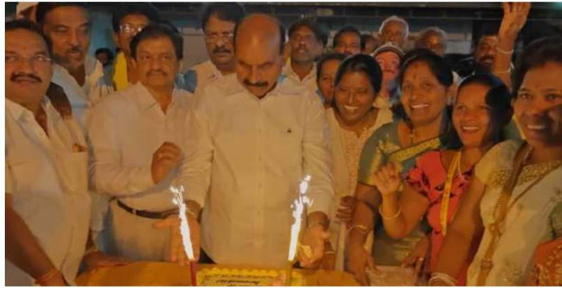
నంద్యాల గడ్డపై వెల్లివిరుస్తున్న విజయ గీతిక - మన రాజధాని, మన అమరావతి

నంద్యాల సీట్ బ్యారో ఏప్రిల్ 2 ( నంది పత్రిక ) నంద్యాల ఆంధ్రప్రదేశ్ ప్రజల ఆత్మగౌరవాన్ని ప్రతిబింబించే అమరావతి రాజధానికి చట్టబద్ధత కల్పించే చారిత్రాత్మక నిర్ణయం నేపథ్యంలో ఆంధ్రప్రదేశ్ ముఖ్యమంత్రివర్యులు నారా చంద్రబాబునాయుడు గారి ఆదేశాల మేరకు నంద్యాల నియోజకవర్గ టీడీపీ పార్టీ కార్యాలయంలో ఈ రోజు సాయంత్రం ఆంధ్రప్రదేశ్ రాష్ట్ర న్యాయశాఖ మరియు మైన్స్ సెక్షన్ల శాఖ మంత్రివర్యులు ఎన్ఎండి ఫరూక్ గారి ఆధ్వర్యంలో కేక్ కడింగ్ నిర్వహించి అనంతరం పార్టీ కార్యాలయం నుంచి పద్మావతి ఆస్ట్రో వరకు భారీ కొవ్వొత్తుల రాల్చి నిర్వహించడం జరిగింది నా రాష్ట్రం ఆంధ్రప్రదేశ్ నా రాజధాని అమరావతి అనే నినాదాలు పలికారు. ఈ