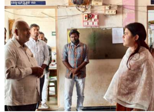
కలెక్టర్ తెలిపారు. ప్రజలకు మెరుగైన మౌలిక వసతులు అందించడంలో ఎలాంటి నిర్లక్ష్యం ఉండకూడదని, సమస్యలు గుర్తించిన వెంటనే పరిష్కారానికి చర్యలు తీసుకోవాలని కలెక్టర్ స్పష్టం చేశారు.

వేగవంతంగా ఉండాలని అధికారులను ఆదేశించారు. ఈ సందర్భంగా ఠి-సర్వే ప్రక్రియపై సమీక్ష నిర్వహించిన కలెక్టర్, ఫేజ్-3, ఫేజ్-4 కింద ఎన్ని గ్రామాల్లో సర్వే పూర్తయిందో అధికారులను అడిగి వివరాలు తెలుసుకున్నారు. ఠి-సర్వే పనులు నిర్దిత కాల వ్యవధిలో పూర్తయ్యేలా చర్యలు తీసుకోవాలని సూచించారు. అలాగే పీజీఆర్ఎస్ (పీజీఆర్ ఎస్) ద్వారా అందుతున్న ప్రజా ఫిర్యాదుల పరిష్కార విధానాన్ని పరిశీలించిన కలెక్టర్, ఫిర్యాదులను నిర్ణయం చేయకుండా సమయానికి పరిష్కరించాలని అధికారులను ఆదేశించారు. రికార్డులను సక్రమంగా నిర్వహించడంతో పాటు, కార్యాలయ పరిసరాలను పరిశుభ్రంగా ఉంచుతూ శుభ్రతపై ప్రత్యేక దృష్టి పెట్టాలని సూచించారు. అనంతరం గ్రామపంచాయతీ పరిధిలో రోడ్లు, డ్రైనేజీలు సరిగా లేవని గ్రామ ప్రజలు చేసిన విజ్ఞప్తిని పరిగణనలోకి తీసుకున్న జిల్లా కలెక్టర్, సంబంధిత ప్రాంతాలను ప్రత్యక్షంగా పరిశీలించారు. పంచాయతీరాజ్ శాఖ ద్వారా రోడ్లు, డ్రైనేజీ పనులు చేపట్టేందుకు చర్యలు తీసుకుంటామని