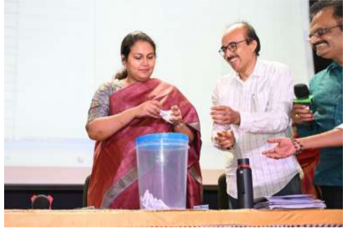
ఆహార పదార్థాల్లో నాణ్యత, శుభ్రత పాటించాలి.