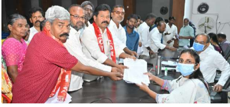
కర్నూలు ప్రతినిధి నందిపత్రిక కర్నూల్ మున్సిపల్ కార్పొరేషన్ పరిధిలోని కె సి కెనల్ ప్రక్కన ఉన్న కార్మిక్ మార్కెట్ నగర్ వాసులకు ఒరిజినల్ పట్టణం ఇవ్వాలని సోమవారం