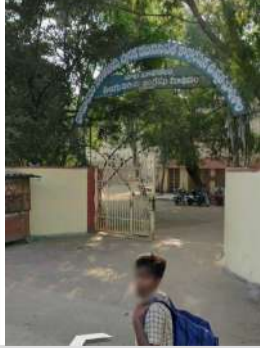
ప్రిన్సిపల్ సెన్సస్ ఆఫీసర్ మాట్లాడుతూ... ఇంటిగ్రేషన్ ప్రక్రియలో ప్రతి వివరాన్ని నిశితంగా సమాధు చేయడం ద్వారా