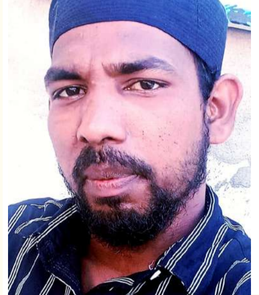
సీసీ కెమెరాల ఆధారం కరీముల్లా ను హత్య చేసిన వ్యక్తులను గుర్తించాలంటే పోలీసులు బండి అత్యకారులో

ఏర్పాటుచేసిన సీసీ కెమెరాలపైనే ఆధార పడ్డాలు ఉంటుంది. బండి అత్యకారు పోలీస్ స్టేషన్ పై భాగంలో ఉన్న కొత్త కొట్లలో కరీముల్లా నివాసం ఉంటున్నాడు. నిందితులు కరీముల్లాను హత్య చేయకముందు పోలీస్ స్టేషన్ పై నుండి కొత్తకోట్లకు వెళ్లి అతనిని తీసుకొని వెళ్ళారని తెలుస్తోంది. బండి అత్యకారు పోలీస్ స్టేషన్ లో కూడా సీసీ కెమెరాలను ఏర్పాటు చేశారు. స్టేషన్లు ఎవరు వస్తున్నారు ? ఎవరు వెళుతున్నారు? అన్న విషయాలను గుర్తించేందుకుగాను పోలీసులు స్టేషన్లో సీసీ కెమెరాల ఏర్పాటు చేశారు. కెమెరాలలోపలి భాగంలో ఉన్న కారణంగా పోలీస్ స్టేషన్లు వచ్చిపోయే వ్యక్తులు మాత్రమే కెమెరాలలో రికార్డు అవుతారు. బయట ప్రాంతంలో తిరిగి వ్యక్తులు కెమెరాలలో నమోదు కారు. పోలీస్ స్టేషన్లో కాకుండా, జ్యోతి పబ్లిక్ స్కూల్ ప్రాంతంలోనూ, బస్టాండ్ ప్రాంతంలోనూ పోలీసులు సీసీ కెమెరాల ఏర్పాటు చేశారు. ఈ కెమెరాలను పరిశీలిస్తే, నిందితులను సులభంగా గుర్తించే అవకాశం ఉంటుంది. పోలీసులు ఆ నెలకా కూడా ప్రయత్నాలు చేస్తున్నట్లుగా తెలుస్తోంది. దీని రోజుల క్రితం బండి అత్యకారుతో జరిగిన ఓ డాంగతనం కేసులో నిందితుడిని సీసీ కెమెరాల ఆధారంగానే గుర్తించి అరెస్టు చేసి రిమాండ్కు పంపడం జరిగింది.