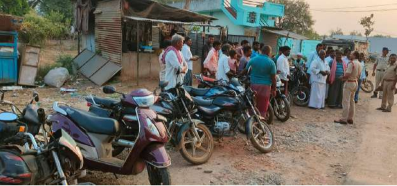
ద్రువపత్రాలు లేని వాహనాలకు జరిమానాలు అక్రమ మద్యం స్వాధీనం